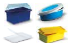
Barquettes et ravier