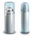
Aérosols alimentaires et cosmétiques