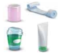
Pots et tubes