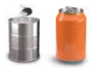
Canettes et boîtes de conserve